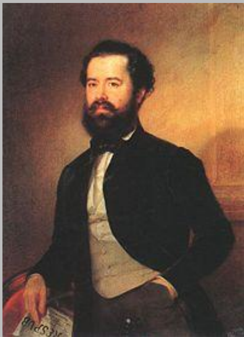
Szemere Bertalan kormánybiztos