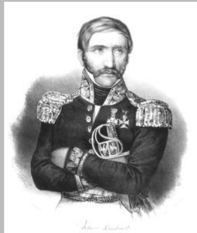
Henrik, Dembinsky altábornagy, főparancsnok