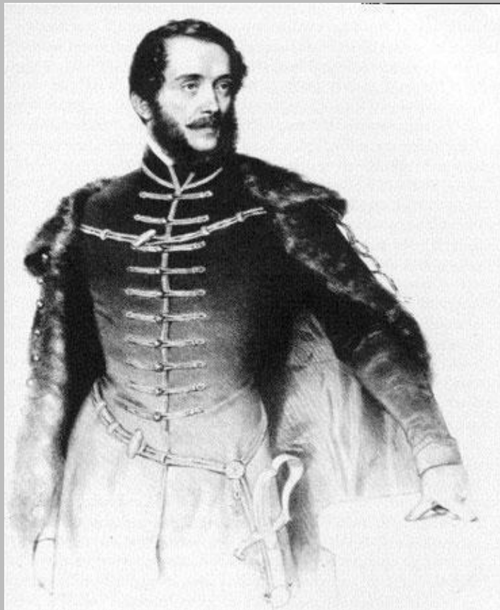
Kossuth Lajos, az OHB elnöke