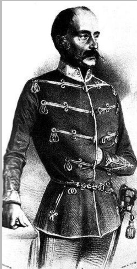
Mészáros Lázár hadügyminiszter