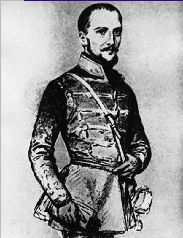
Görgey Artúr, tábornok, hadtest- majd főparancsnok