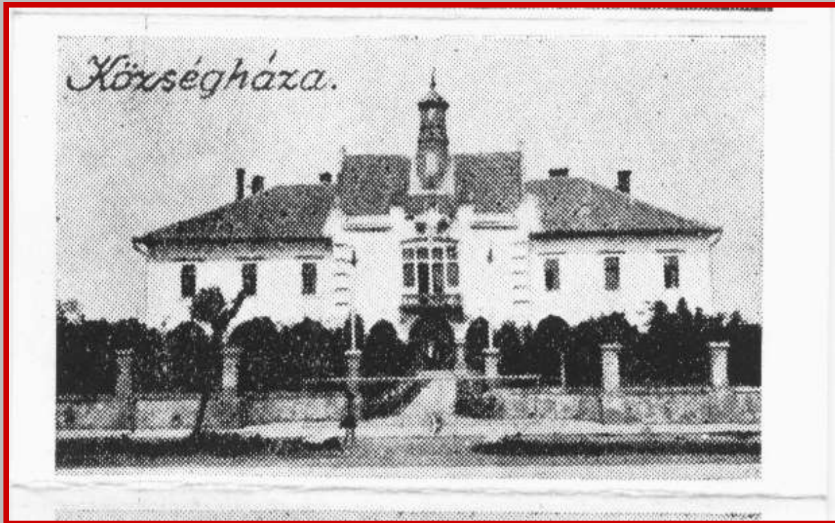
Városháza - ennek a helyén volt a Bernáth-ház